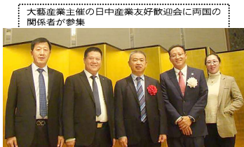
大藝産業主催の日中産業友好歓迎会に両国の関係者が参集