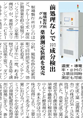
高耐熱性樹脂で 発明奨励賞受賞

本記事は、化学工業の最新動向と技術革新について詳しく解説しています。持続可能な社会の実現に向けて、化学産業の役割はますます重要になっていくと見られています。